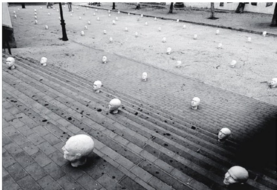
Uan Flores. 'Proyecto cabezas' serà una de les propostes complementàries de la fira.